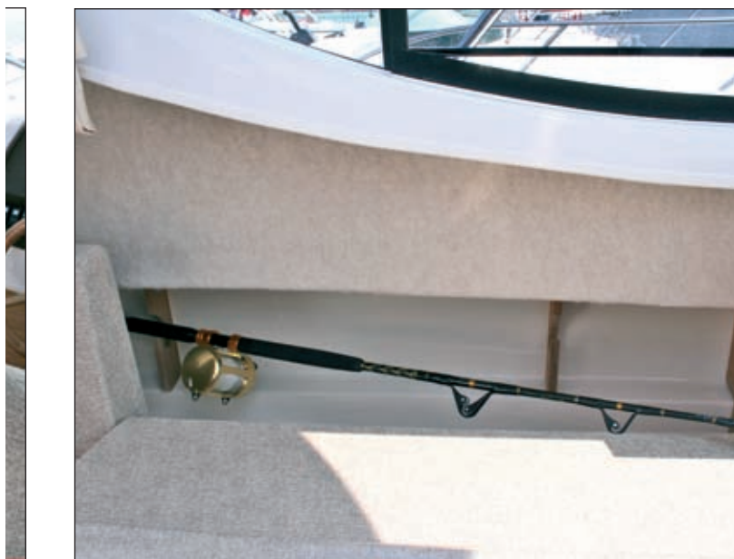
Iza klupe na lijevoj strani kabine mjesto je za tri rezervna štapa

Paluba Dorada 26 projektirana je tako da osigura udobnost i ribičima i obitelji. Širi-