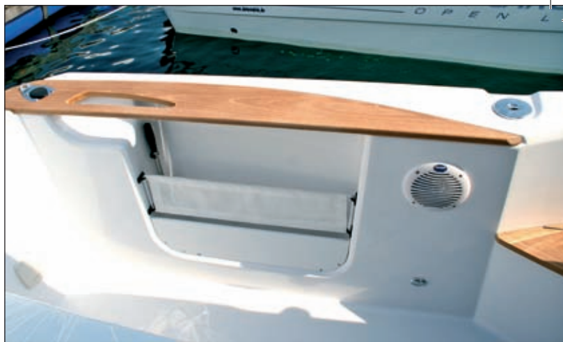
Razma od tikovine s držačima za ruke i ugrađeni nosač štapa

okret. Naš prijatelj Rudi trudio se Dorado 26 dovesti u nepriliku, no brod je mirno radio zaoakrete tako da je na kraju Rudi odustao. Brod lagano siječe val i na njega nasjeda, a zbog platforme, nema vrtloženja mora pa se sa strane čini kao da brod lebdi nad morem. Potpuno opremljen i s punim spremnicima za gorivo i vodu Dorado 26 vjerojatno bi još bolje “ležao” na valu, no i ovako je zaslužio odličnu ocjenu. ☞