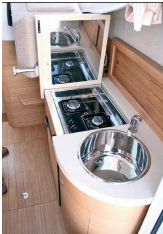
Sudoper, kuhala ispod skiperova sjedala, hladnjak i spremište za posuđe – sve je tu

nom od 2,7 m i dužinom od 2 m, paluba je dovoljno velika da nekoliko ribiča može normalno komunicirati. Dorado 26 ima veliku platformu od tikovine, a u njoj su skrivene preklopne ljestve za silazak u more. Na desnoj strani broda su vrata prema palubi, a na sredini stražnjega dijela krme su poklopac motora koji može poslužiti kao sjedalo i tuš na izvlačenje. S obje strane palube razma je proširena tikovom daskom u kojoj su prorezi koji služe kao držači za ruke, a u razmu su ugrađeni i nosači za štapove. U podu, ispod velikoga poklopca smješteni su spremnici za gorivo i vodu. U prolazu prema pramcu, sa svake strane kabine je stepenica i svaka ima svoju ulogu: u lijevoj je spremnik za živu ješku, a u desnoj spremište za plinску bocu. Poklopci stepenica su od tikovine, a jednostavno se skidaju. Za siguran hod