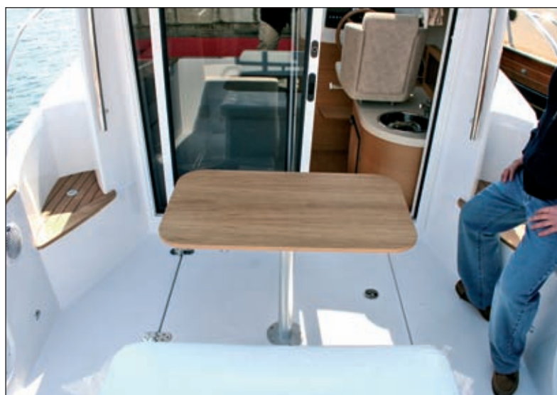
...a sve se može jednostavno premjestiti na palubu

klopnog sjedala. Pod kuhalom su hladnjak i veliko spremište za posuđe i namirnice. Pred skiperom su timun i kontrolni instrumenti motora, dok je mjesto za elektroniku predviđeno na ploči iznad prednjih prozora. Elektronika, nažalost,