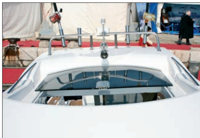
Provjetravanje kabina omogućava veliki otvor na krovu