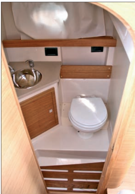
Mokri čvor s WC-om, umivaonikom, tušem i obiljem pretinaca