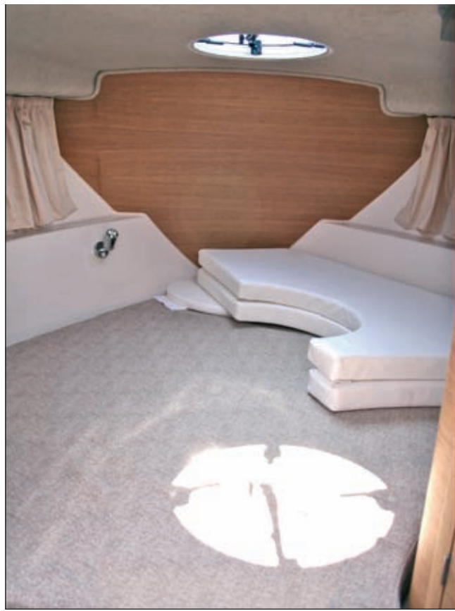
Krevet je dovoljan za dvije osobe

hvaliti svi ribiči. Ispod klupa su velika spremišta za posteljenu i slično. Na podu je rupa za nosač stola kad je klupa preklopljena, a isti se stol može postaviti i na palubu. U pramčani se dio kabine ulazi s lijeve strane, a ulaz nije zatvoren. Nakon klupa slijedi još jedan red polica i uz njih se silazi u spavaći dio. Na desnoj strani, ispod timuna i instru-