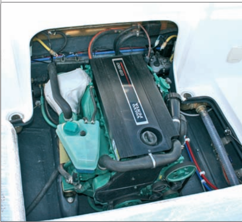
Srce Dorada 26 od 190 KS

nije bila ugrađena jer je brod na sajam došao izravno iz tvornice. U desnom zidu kabine su spremišta, od onog za kužinu do spremišta za mnoge prijeko potrebne sitnice. S lijeve strane vrata su male ladice koje se izvlače ispod klupe. Klupa na lijevoj strani kabine pretvara se u ležaj za dvoje, a u stijeni kabine je i spremište s držačima za rezervne štapove, što će po-