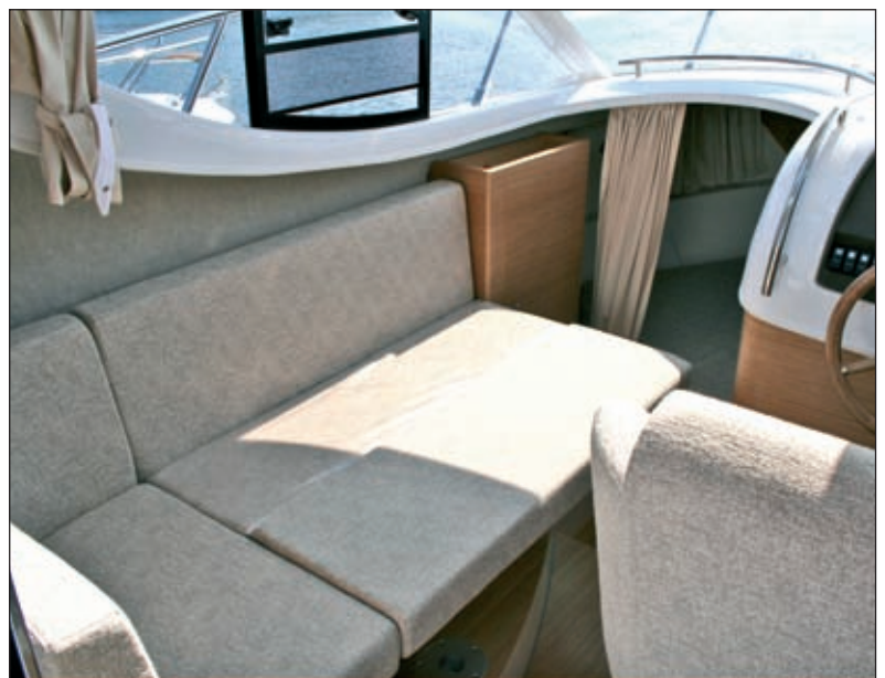
Stol se miče i klupa se pretvara u ležaj