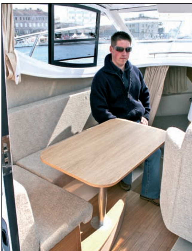
Kada je grubo vrime, spiza se služi u kabini...

vratima, velikim prozorima sa strane i sprijeda, te svijetlom drvu i svijetloj presvlaci u brodu. Odmah do vrata s desne strane je okrugli sudoper i kuhalo s dva plinska plamenika. Kuhalo je u normalnoj vožnji skriveno ispod skiperova pre-