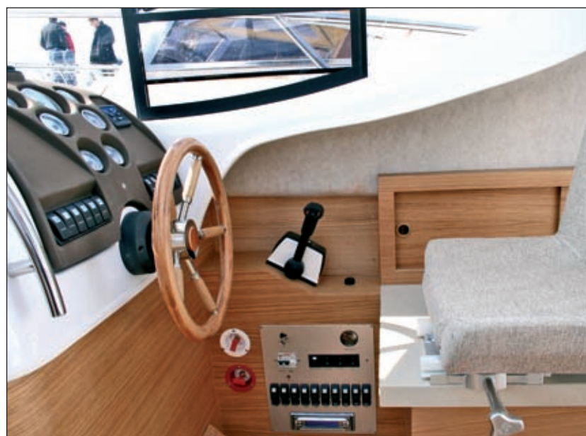
Radno mjesto po mjeri čovjeka