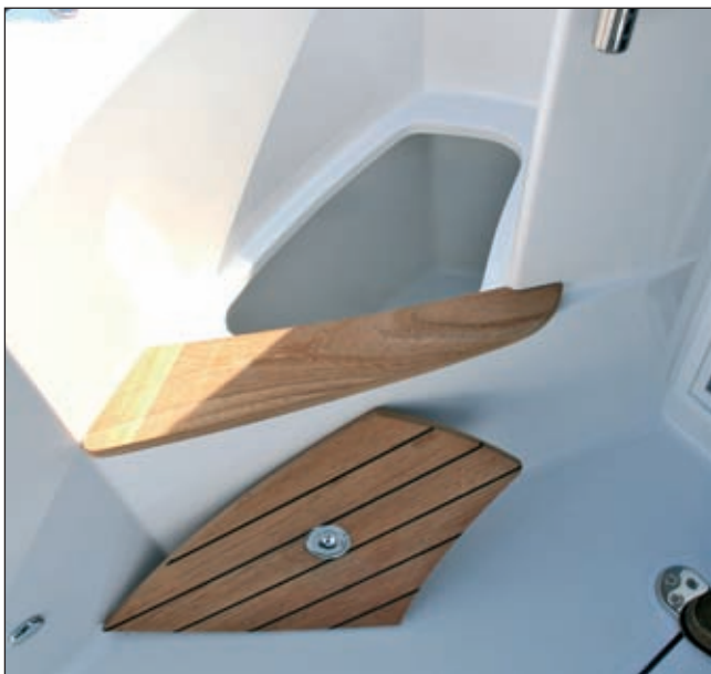
Spremnik za živu ješku u stepenici prema pramcu