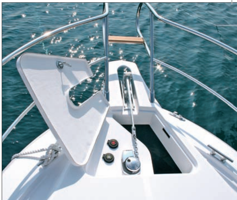
Baštun i sidro s otvorom za lanac i konopce

ali ne i kod Dorada 26 . Naime, u krov je ugrađen, automobilskim žargonom rečeno, "šiberdah", a na krovu su i nosači štapova. Krov se jednostavno pomakne i zrak nesmetano struji po kabini. Na pramcu je mali baštun s električnim