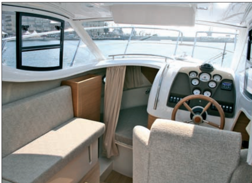
Veliki prozori, otvor na krovu, svijetlo drvo i preslake kabine čine većom