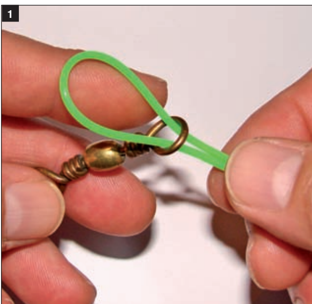
1 Presavijenu i udvojenu strunu treba provući kroz 'oko' predmeta koji vezujemo. U ovom slučaju to je oko zogulina