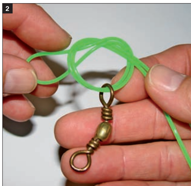
2 Provučenim i udvojenim krajem strune formira se običan čvor koji se ne zateže