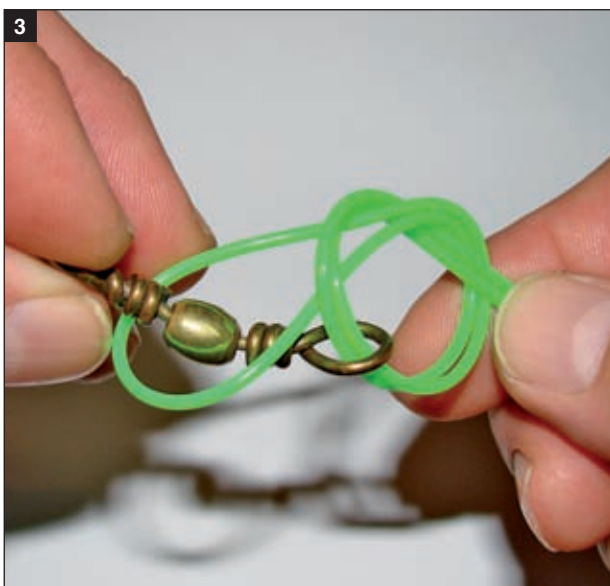
3 Zogulin se provlači kroz završni dio polupetlje, istovremeno pridržavajući živi kraj da se ne bi izvukao iz nezategnutog čvora