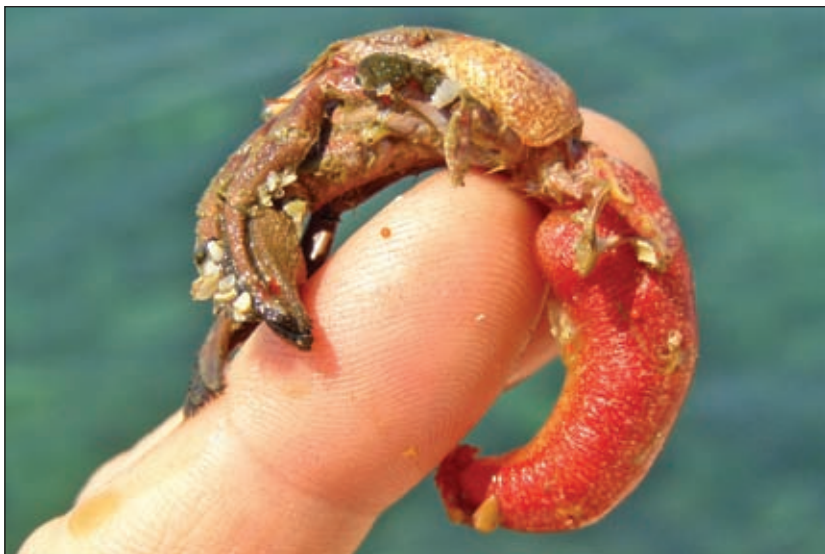
Raku samcu je nemoguće odoljeti, pogotovo kada je bez kućice