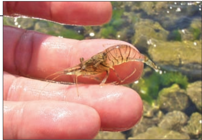
Kozicu neće odbiti niti jedna morska riba koja imalo drži do sebe