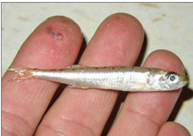
Gavun je omiljen obrok i brancinima i ušatama