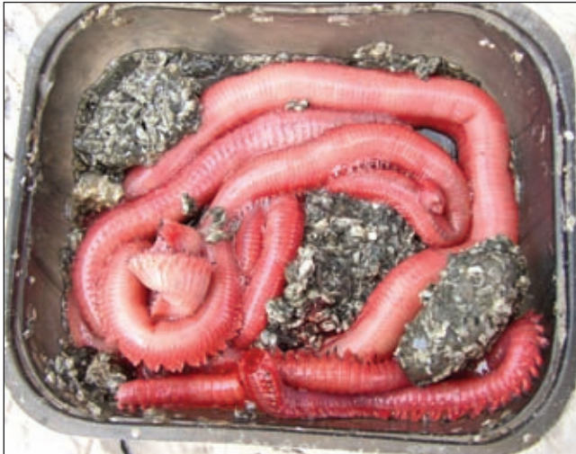
Cordelle, mada nisu autohtona vrsta, omiljena su hrana svih karnivora