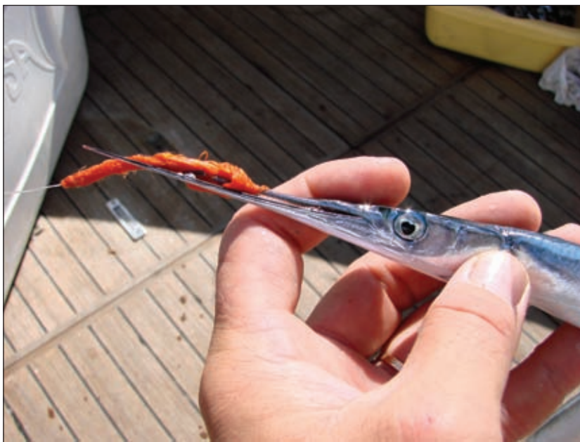
Nekima je pak sintetička matasina tako privlačna da joj ne mogu oprostiti