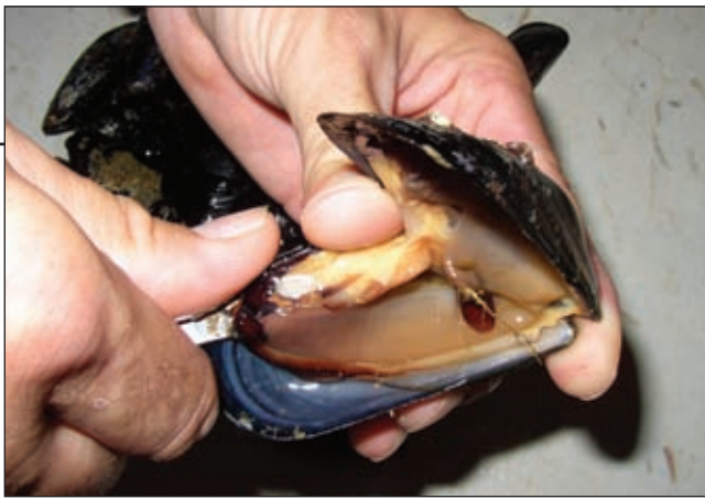
Dagnja je omiljena hrana svih šparida