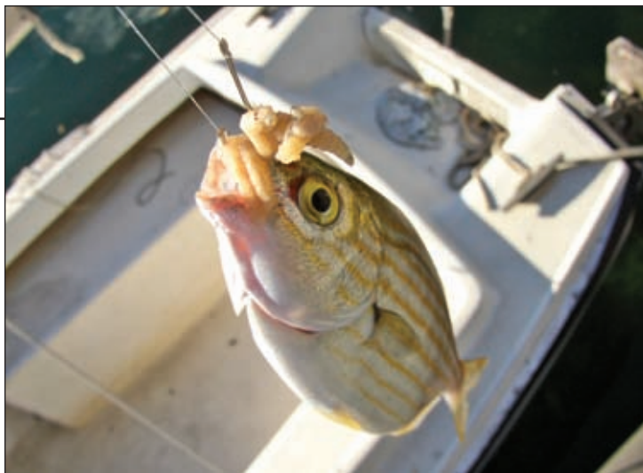
Salpe su lakome na 'bigatine', mesne crve