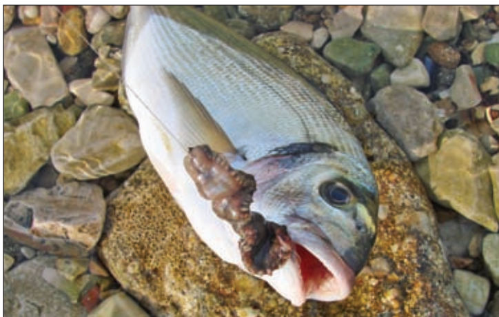
Podlancama je veliki crv neodoljiv