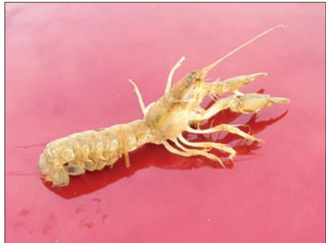
Gambor je rak kojega ribe naprosto obožavaju