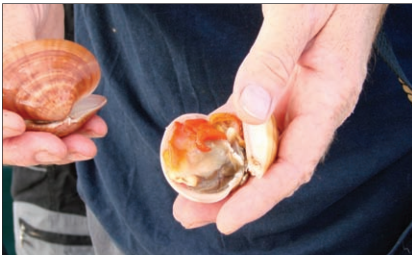
Lakirke se jednostavno otvaraju, a mnogi ih ješkaju cijele