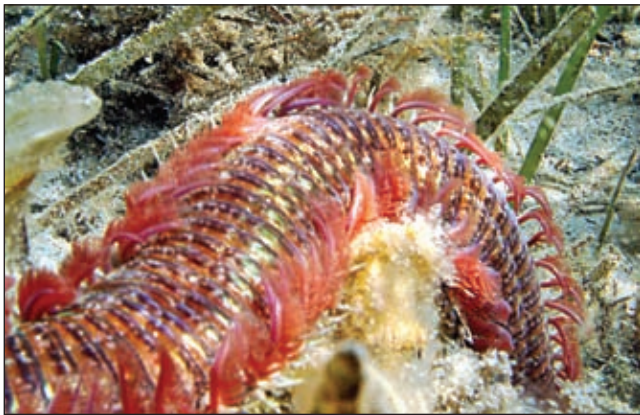
Veliki je crv ješka broj jedan za plemenite šparide