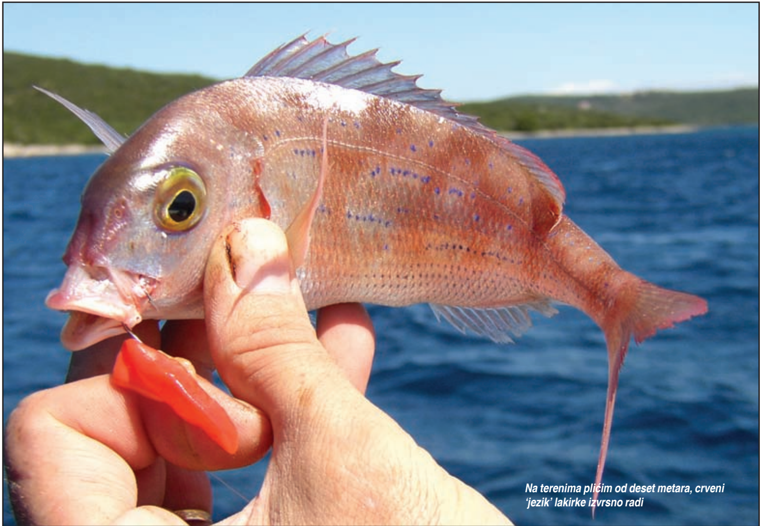
Na terenima plićim od deset metara, crveni 'jezik' lakirke izvrsno radi