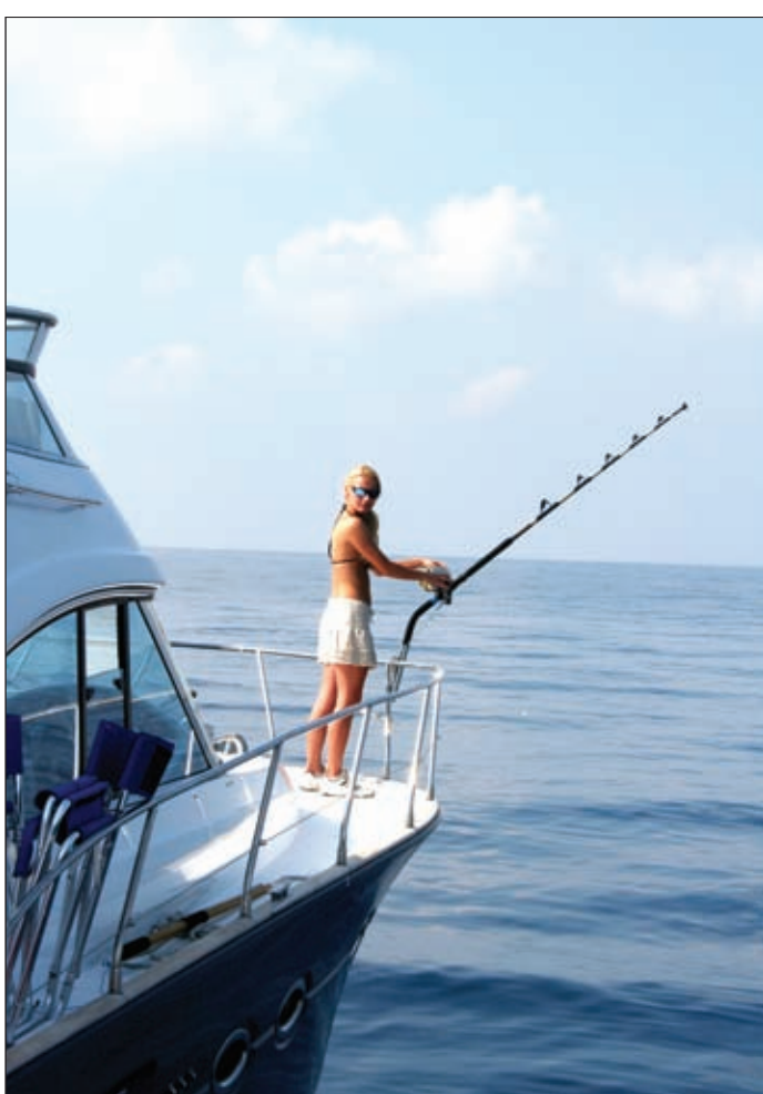
Dobraaaa... pozicija za štap na pramcu