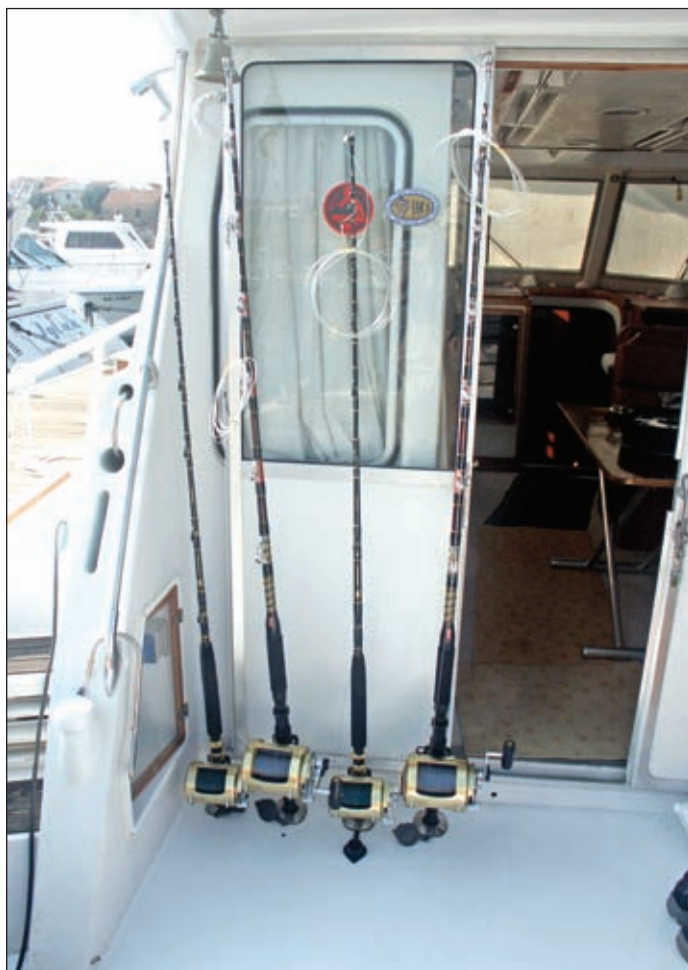
Štapovi u nosačima na podu palube