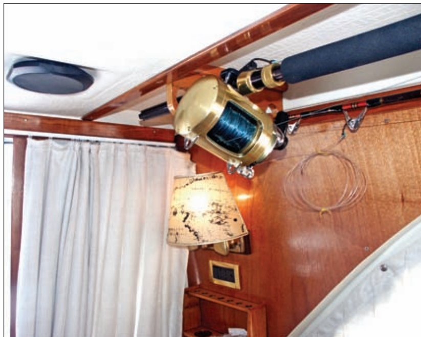
Nosači štapova na stropu kabine

koristimo. Za štapove koje trenutno ne koristimo pojedini fishermani imaju pripremljena mjesta u bokovima i kabinama, gdje nosači mogu biti postavljeni ili na stropu ili u podu, a najčešće su montirani na zadnji dio nadgrađa – na T-topu, flying bidgeu ili tuna toweru .