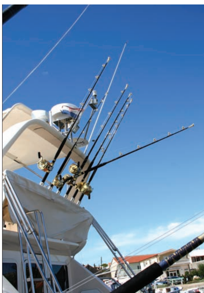
Uobičajeno mjesto za smještaj štapova na flying bridgeu