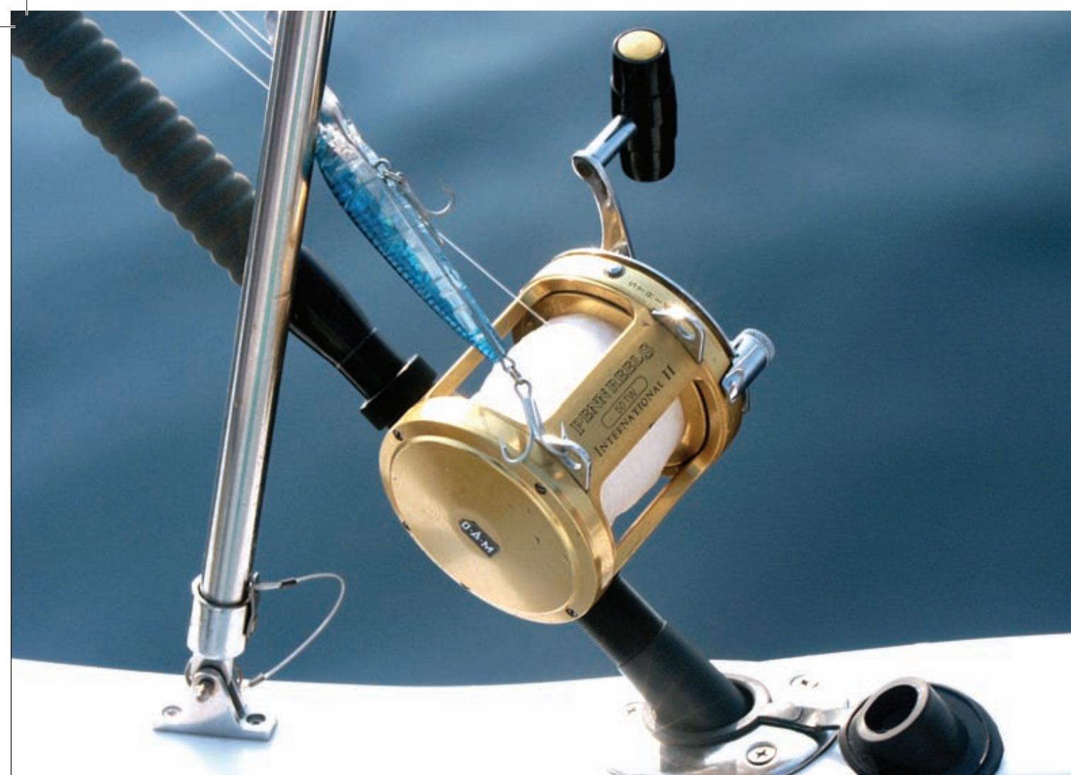
Dobar smještaj štapa narušava nosač bimini-topa