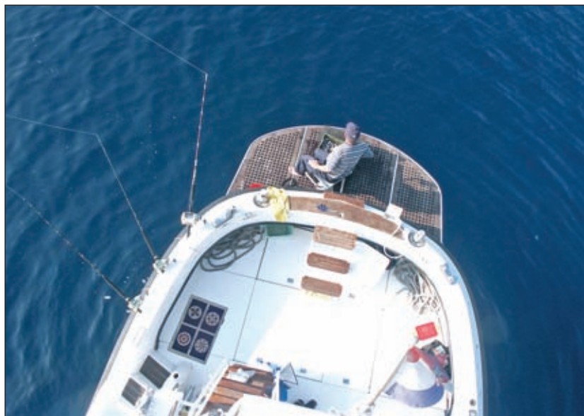
Na Calafuriji 42 štapovi su postavljeni prema receptu legendarnoga francuskog ribiča Constanta Guigoa

Svi u ribolovu imamo svoj đir po brodu, pa stoga treba odabrati proizvođača koji zadovoljava naš ribički ukus. Po-najprije treba povesti računa o nosačima ribičkih štapova, jer upravo njih većina proizvođača zanemaruje, te nije neobično da na fishermanima poznatih tvrtki imamo nosače za samo dva štapa, i to uglavnom tamo gdje se sastaju bokovi i krmeno zrcalo, iako na bo-