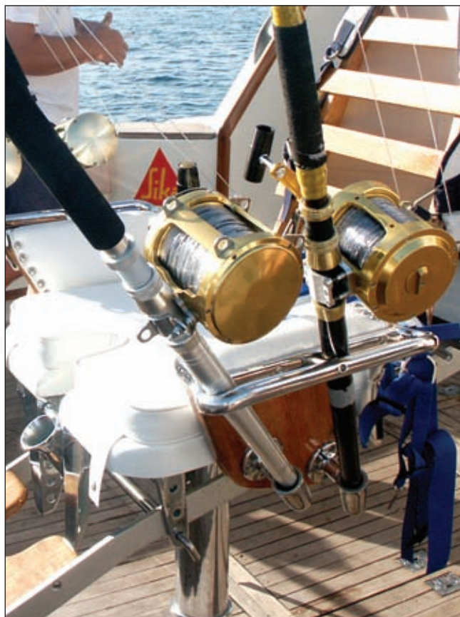
Svaka borbena stolica ima držače za najmanje dva štapa

ru krme, a dva lagano nakošena prema bokovima, odnosno prema vanjskoj strani broda. Neki ribiči vole montirati dodatne držače na samo krmeno zrcalo, ali pritom treba paziti na konstrukciju plovila. Naime, nisu svi brodovi jednako građeni, zato provjerite debljinu stijenke na krmenom zrcalu i radije s unutrašnje strane dodajte neku ploču, drvenu ili čeličnu, a sve učvrstite jakim vijcima.