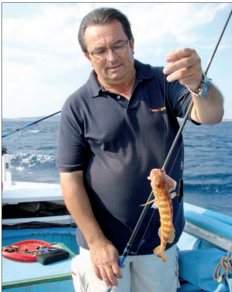
Još jedan u nizu

Počtnici udičari ga često brkaju sa škartocem ili vučićem ( Serranus hepatus , Linnaeus, 1758.) pogotovo kada je riječ o juvenilnim primjercima pri čemu ulovljeni kanjci gotovo redovito stradavaju zbog grubog rukovanja, nažalost najčešće namjernog. ☞