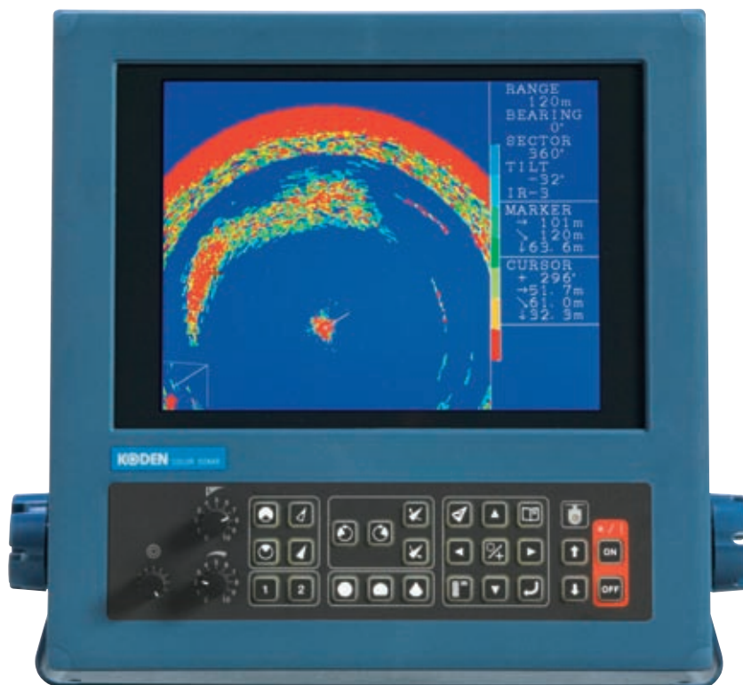
Slika predstavlja jedan sektor (dio luka), a mrlja ispod je riba