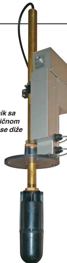
Primopredajnik sa crnom cilindričnom sondom koja se diže i spušta